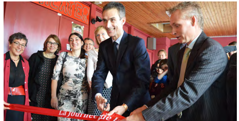
Opening van de Dag van de Franse taal 2016 door de Franse ambassadeur