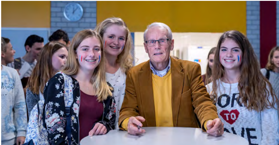
Wielerslegende Jan Janssen als gastdocent op het Ostrea Lyceum in Goes

Zo wordt aan leerlingen duidelijk gemaakt hoe nuttig en plezierig het is om je in de Franse taal en cultuur te verdiepen. Dat Frans leeft in Nederland, is ook in de media goed te merken: veel radiozenders, kranten en websites besteden op die dag aandacht aan het evenement of aan Franse cultuur in het algemeen.